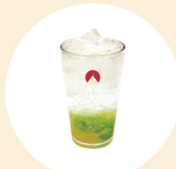
리얼애플에이드 Real Apple Ade