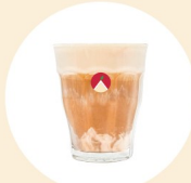
사과라떼당 Sagwa Latte Dang