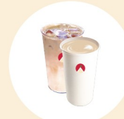
사과당 밀크티 Apple Ice Cream