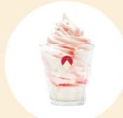
사과당 아이스크림 Apple Ice Cream