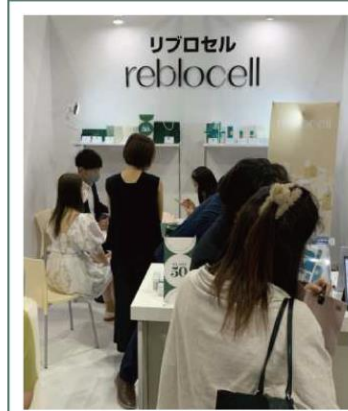
일본 오사카 뷰티 엑스포