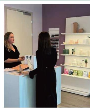
스위스 유나코스메틱 스튜디오