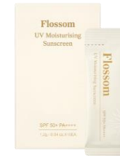
플로섬 UV 모이스처라이징 선스크린 (미니)