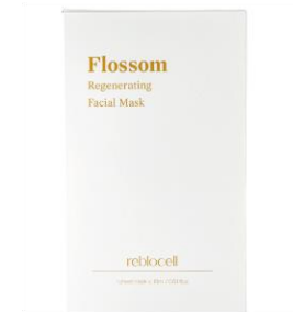
플로섬 리제너레이팅 페이셜 마스크 (EGF 1ppm)