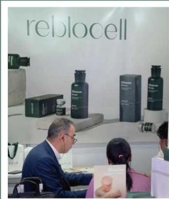
일본 도쿄 뷰티앤헬스