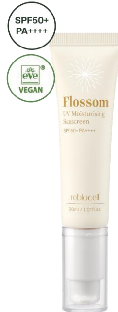
플로섬 UV 모이스처라이징 선스크린 (30ml)