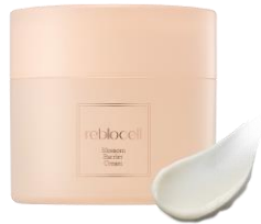
블로섬 베리어 크림