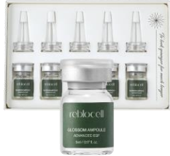
글로섬 앰플 EGF (5ea)