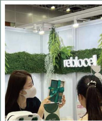
IBE 말레이시아, 쿠알라룸푸르