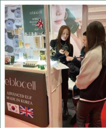
영국 런던프로페셔널 뷰티