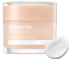
블로섬 워터드롭 크림