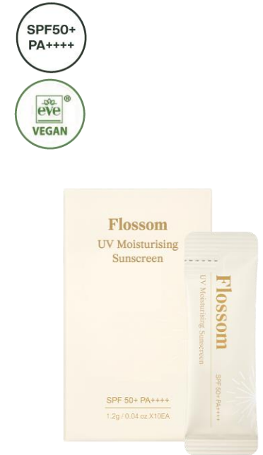
플로섬 UV 모이스처라이징 선스크린 (미니)