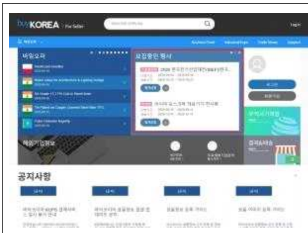
바이코리아 <모집중인 행사> 클릭

▶ <2021 K-서비스 온라인 수출대전 온라인 특별관> 으로 검색하여 해당하는 산업 분야로 참가