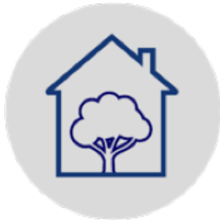
Quality of Life